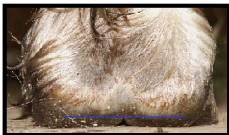
Barfota och rätt verkad.

På en häst som går med för höga hovväggar och/eller metallskor blir höjdförhållandet mellan mark, sula och stråle onaturligt med resultat att hoven ovillkorligen deformeras (traktrång) vilket medför en kraftig försämring av hovens blodcirkulation. Detta leder i sin tur till försämrade tillväxt, försämrade motståndskraft, försämrade material-kvalité och försämrade läkningsförmåga.